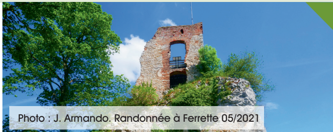
Randonnée à Ferrette 05/2021

Le club de randonnée de la Maison Pour Tous propose des randonnées variées et accessibles pour tous niveaux (3 niveaux de difficulté) avec une diversité de lieux et de paysages. Venez pratiquer ce sport de nature sans aucune interruption en cours d'année, en 1/2 journée, journée ou séjour annuel. Le club vous offre la possibilité de participer à deux randonnées d'essai avant l'adhésion.