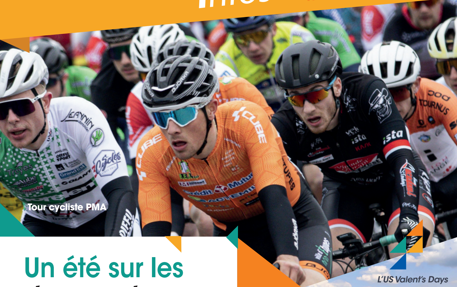
Tour cycliste PMA