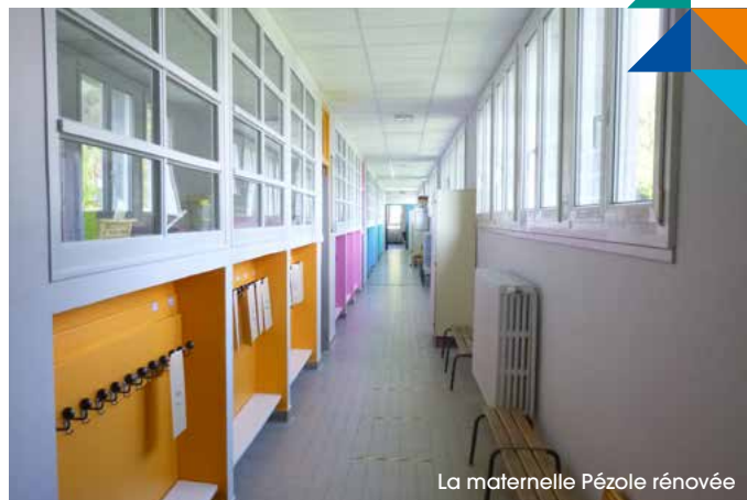
La maternelle Pézole rénovée

Des travaux d'entretien et de rénovation sont régulièrement réalisés dans les écoles boroillottes. Au cours de l'été 2021, de nombreux travaux ont été effectués dans les groupes scolaires de la Ville pour des montants significatifs. La maternelle Pézole par exemple, a fait l'objet d'une réhabilitation complète : plafonds acoustiques, éclairage led, rénovation des toilettes et des couloirs... Coût de cette opération : 54 000€ .