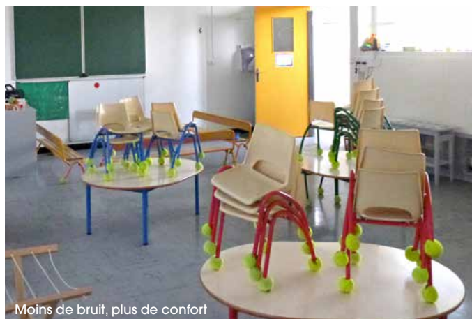
Moins de bruit, plus de confort

Afin de limiter les nuisances sonores dans les classes, les pieds des chaises sont équipés de balles de tennis. Cette technique, éco-responsable et ludique, contribue à faire baisser le niveau sonore dans les classes. De plus, les balles servent d'amortisseur et rendent l'assise plus douce pour les enfants.