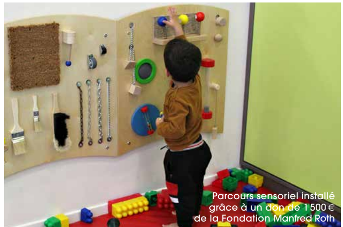
Parcours sensoriel installé grâce à un don de 1 500 € de la Fondation Manfred Roth

Le service «petite enfance», qui regroupe le Relais Petite Enfance et le Multi-accueil propose plusieurs interventions encadrées par des professionnels dans la continuité des activités de l'an dernier. Citons par exemple les séances de bébé gym, de bébé sport, de yoga pour les bébés, d'éveil musical ou encore d'éveil sonore. Ces animations contribuent à l'épanouissement et au développement des enfants.