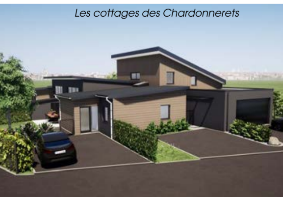
Les cottages des Chardonnerets

remises aux normes, de nouvelles constructions. Plusieurs secteurs de la ville sont concernés par des projets de constructions nouvelles initiées par les organismes logeurs mais aussi par des investisseurs privés. Ainsi, le programme « Les cottages des Chardonnerets », mené justement par un investisseur privé, est déjà sorti de terre. Il s'agit d' un ensemble immobilier de 3 maisons . Ce concept est conçu pour accueillir également les personnes à mobilité réduite.